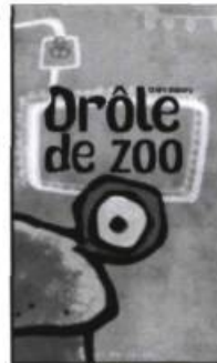
Drôle de zoo Claire Obscure