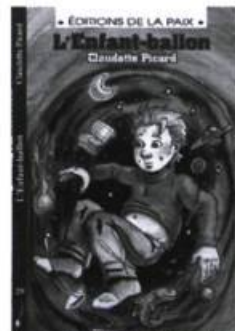
L'Enfant-ballon Claudette Picard