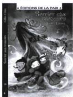
Sorcier aux trousseaux Gilles Côté