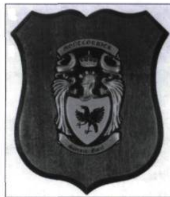
Armoiries des Montcorbier