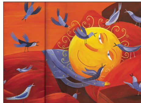
Autour du soleil

haite tenir. Il y a trois ans, l'artiste a eu le goût de raconter une histoire aux enfants, même s'il avoue n'avoir jamais été un grand lecteur. Pendant des semaines, il a cherché un sujet qui le captiverait. C'est en apercevant un rémouleur, un aiguiser de couteaux, qu'un déclic se produit. «Parler d'un vieux métier qui disparaît m'a tout de suite plu», dit-il. Il crée d'abord les personnages, puis, tranquillement, construit à partir d'eux une charmante leçon de vie fantaisiste qui propose une réflexion intéressante sur la société de consommation. L'album, publié en 2008 par Dominique et compagnie, charme tout le monde, en plus d'être finaliste au Prix du Gouverneur général et au Prix TD de littérature canadienne pour la jeunesse, des distinctions qui touchent Rogé au plus haut point. «Que ma première création avec les mots se soit fait autant remarquer, ça me dépasse», s'exclame-t-il.