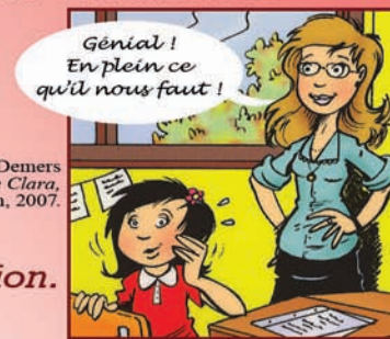
Illustration : Tristan Demers Les lunettes de Clara , Éd. Hurtubise, coll. Caméléon, 2007.

courriel : sonia_k_laflamme@yahoo.fr / site Internet : www.soniaklaflamme.com