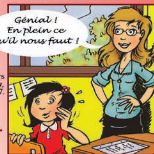
Illustration : Tristan Demers Les lunettes de Clara , Éd. Hurtubise, coll. Caméléon, 2007.

courriel : sonia_k_laflamme@yahoo.fr / site Internet : www.soniaklaflamme.com