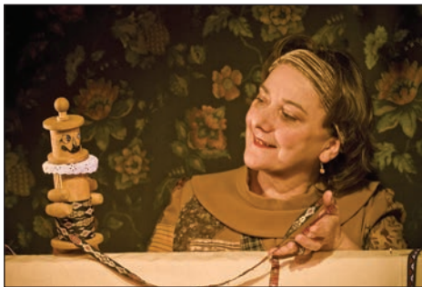
Les habits neufs