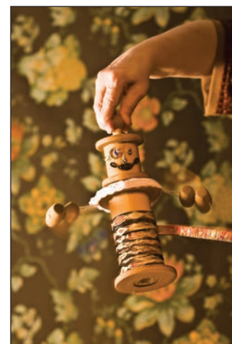
Les habits neufs