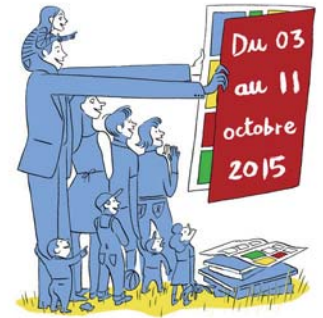
ILLUSTRATION : CYRIL DOISNEAU