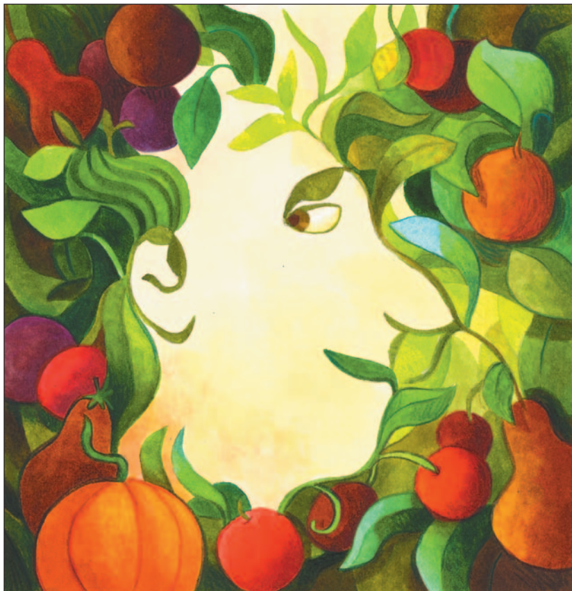
illustration : Caroline Merola

au visage, le véhicule qui s'éloignait. Les élèves riaient et saluaient l'idiot en retour.