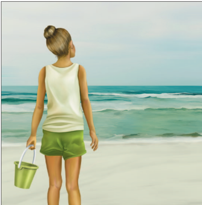
illustration : Laurine Spehner

Je ne suis jamais allée à la plage. La vraie, je veux dire, celle qui a des vagues turquoise et qui laisse sur les lèvres un gout plus salé encore qu'un sac complet de chips sel et vinaigre. «Pourquoi chercher la mer quand nous avons ici le plus majestueux des estuaires?» nous a souvent répété papa, à maman et moi. Je faisais chaque fois semblant de le croire. Si papa avait eu un peu de sous, il nous y aurait amenées sur-le-champ, je le sais bien. Juste pour nous voir heureuses.