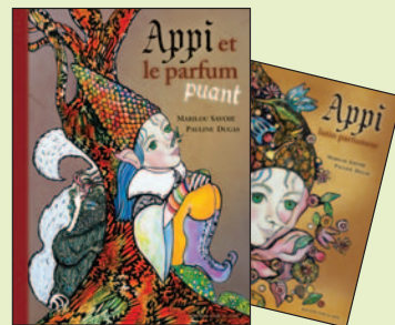
APPI ET LE PARFUM PUANT & APPI LUTIN PARFUMEUR