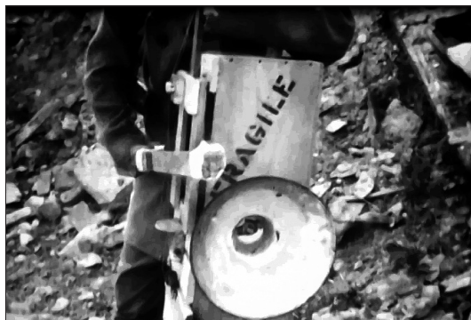
Fig. 3 Réserve des arts, 2012.

Le fond sonore se modifie au gré des contacts entre les trois hommes et leur univers, les Récupérateurs se laissant eux-mêmes guider par les objets : un simple contact avec ceux présents récupérés dans la caisse suffit pour éveiller leur imagination et les transformer en des personnages fantasmés. Les objets, éléments centraux de la projection, déclenchent les événements, font naître les histoires autour des figures d'un alchimiste, d'un colon, d'un soldat ou d'un savant fou : autant de figures qui vivent dans l'attente d'une découverte. Les différentes époques dans lesquelles sont projetés les acteurs sont également envahies d'objets. La récupération est symbolisée à travers les âges : les poilus créent des instruments de musique avec les derniers éléments à leur disposition dans leur camp de fortune (Fig. 3).