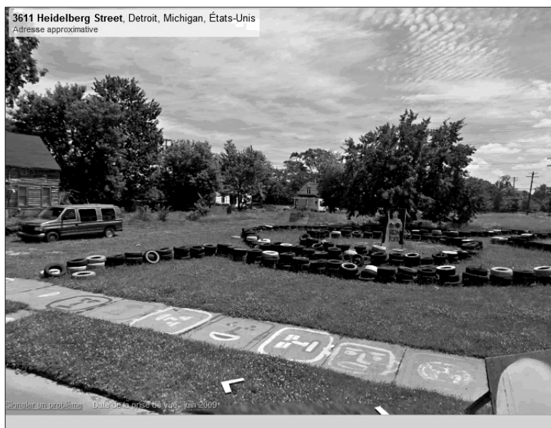
Fig. 4 Réserve des arts, 2012.

socialement et économiquement dévasté par les effets de la mondialisation. Des objets « déchets » ont été récupérés, remaniés, détournés et exposés dans l'espace public.