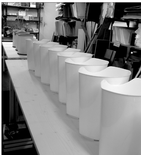
Fig. 5-7 Réserve des arts, 2012.