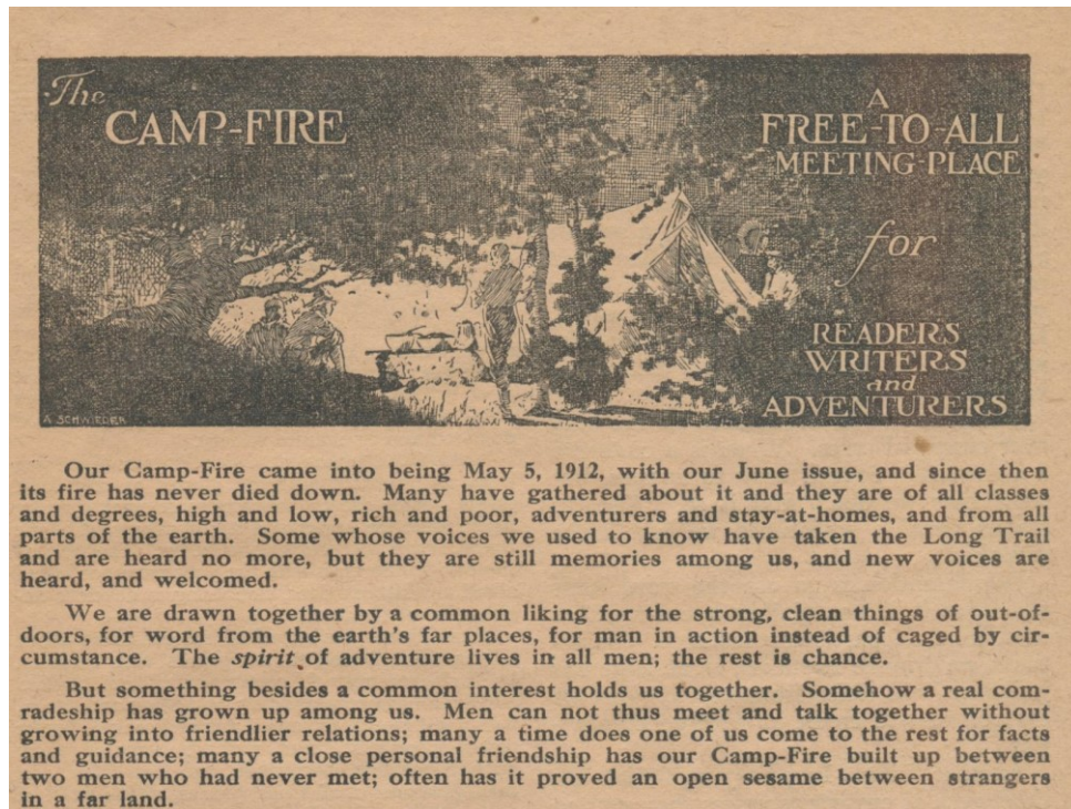
Images 1 et 2 : Frontispices des rubriques « Ask Adventure » et « The Camp-Fire » d' Adventure .

L'illustrateur, les sujets privilégiés et le vocabulaire graphique sont les mêmes que ceux des vignettes offertes en ouverture de chaque récit, manifestant l'unité recherchée entre les récits imaginaires et la manière d'envisager le monde.