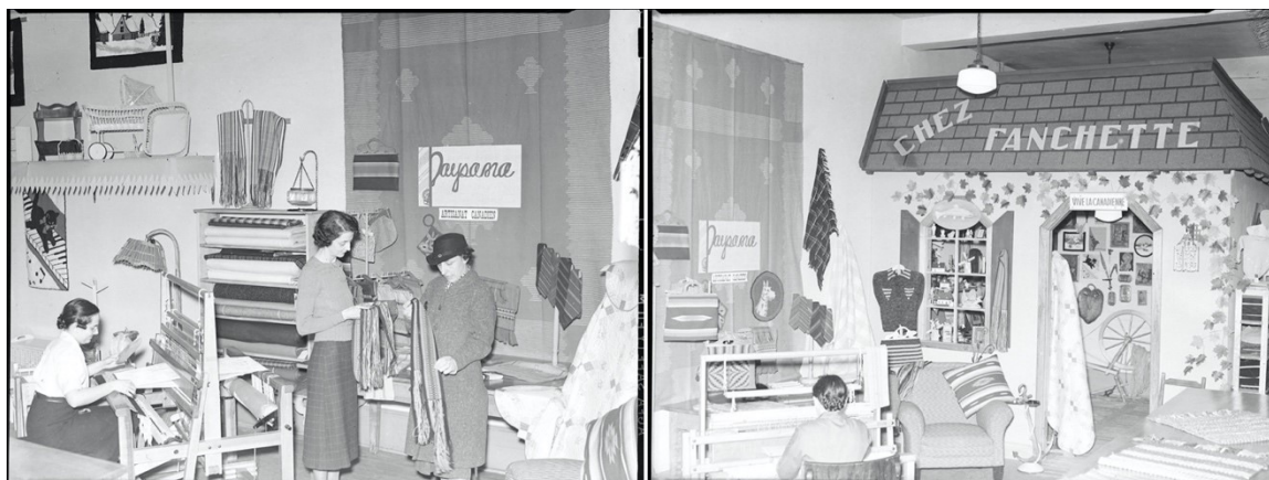
Figure 3. Chez Fanchette, avril 1938. La boutique était sise au 1610 ouest, Sainte-Catherine.