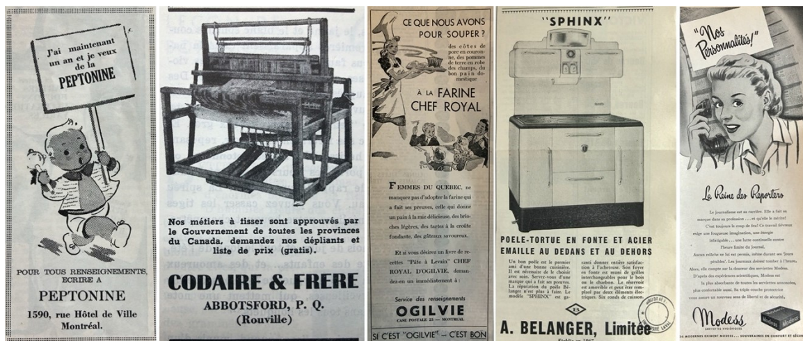
Figure 5 a, b, c, d, e. Exemples de publicités présentées dans Paysana : Peptonine (mai 1939), métiers à tisser Codaire et Frères (janvier 1941), farine Chef Royal d'Ogilvie (mai 1941), poêles A. Bélanger (septembre 1941), et serviettes hygiéniques Modess (mai 1947).

Au fil des années et des numéros, les réclames se diversifient et croissent en nombre, possiblement pour couvrir des coûts de production grandissants. Pour atténuer ses soucis financiers, Françoise doit s'adresser à des hommes, car ce sont eux qui ont l'argent, mais les publicités visent presque exclusivement les femmes. La directrice privilégie ce qui est susceptible d'intéresser la maîtresse de maison en quête de confort et de modernité : serviettes hygiéniques, poêles et autres électroménagers, farine Ogilvie, biscuits David, produits pour nourrisson, margarine, etc. (figure 5).