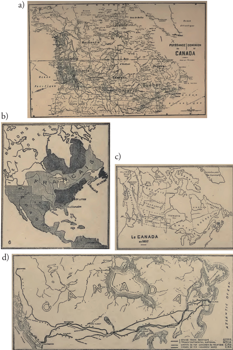
Figure 2 – a) Le cadre physique canadien; b) L’Amérique du Nord et les puissances coloniales c) La Confédération canadienne; et d) Les trois chemins de fer transcanadiens. Cartes tirées de la seconde édition de Terres et peuples du Canada , 1913, p. 21, 40, 62 et 72.