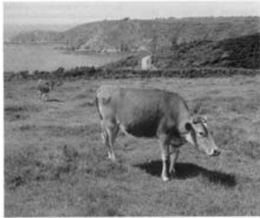
Guernesey: l’île aux mille vaches. (Carte postale, 1987)

Place aux différents chapitres intitulés selon le bon vouloir de mon inspiration, cette inspiration spontanée qui est née à la suite d’une courte histoire d’amour entre une fille de la Manche ou à vécu Victor Hugo et la péninsule où je suis né, la douce et talentueuse Gaspésie.