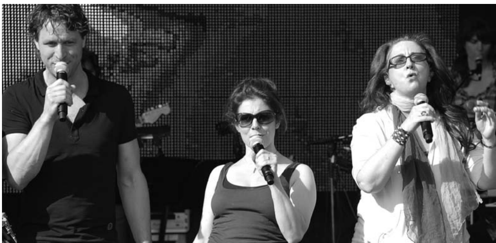
Kevin Parent, Isabelle Boulay et Laurence Jalbert reflètent bien la grande vitalité culturelle de la Gaspésie. Ils sont en répétition pour le grand spectacle marquant le 475 e anniversaire de Gaspé, le 24 juillet 2009.