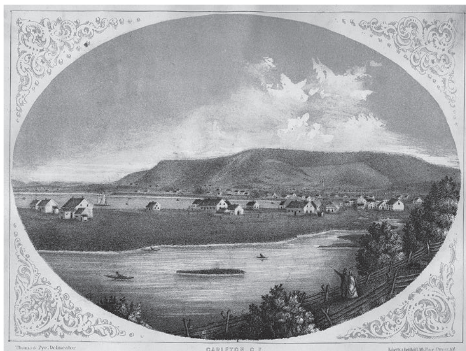
Carleton en 1866.

Image : Thomas Pye, Canadian scenery Gaspé, gravure. Collection Musée de la Gaspésie. NAC : 99.28.395.