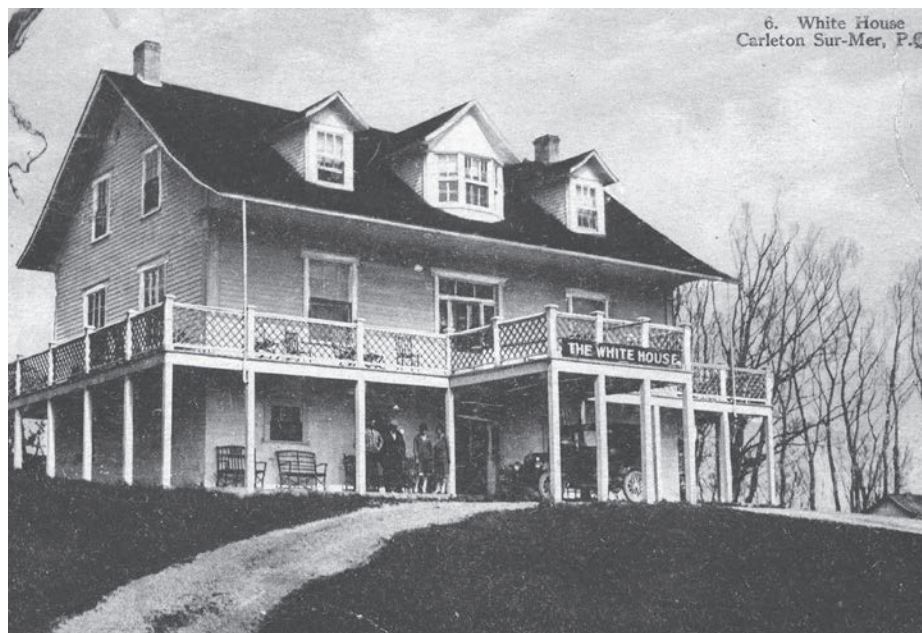
Maison de John Meagher, construite vers 1850, qui deviendra plus tard le « White House ».

Source : Edouard-Hospice Legendre, BANQ – Québec. E21,S555,SS1,SS523,PC.6.