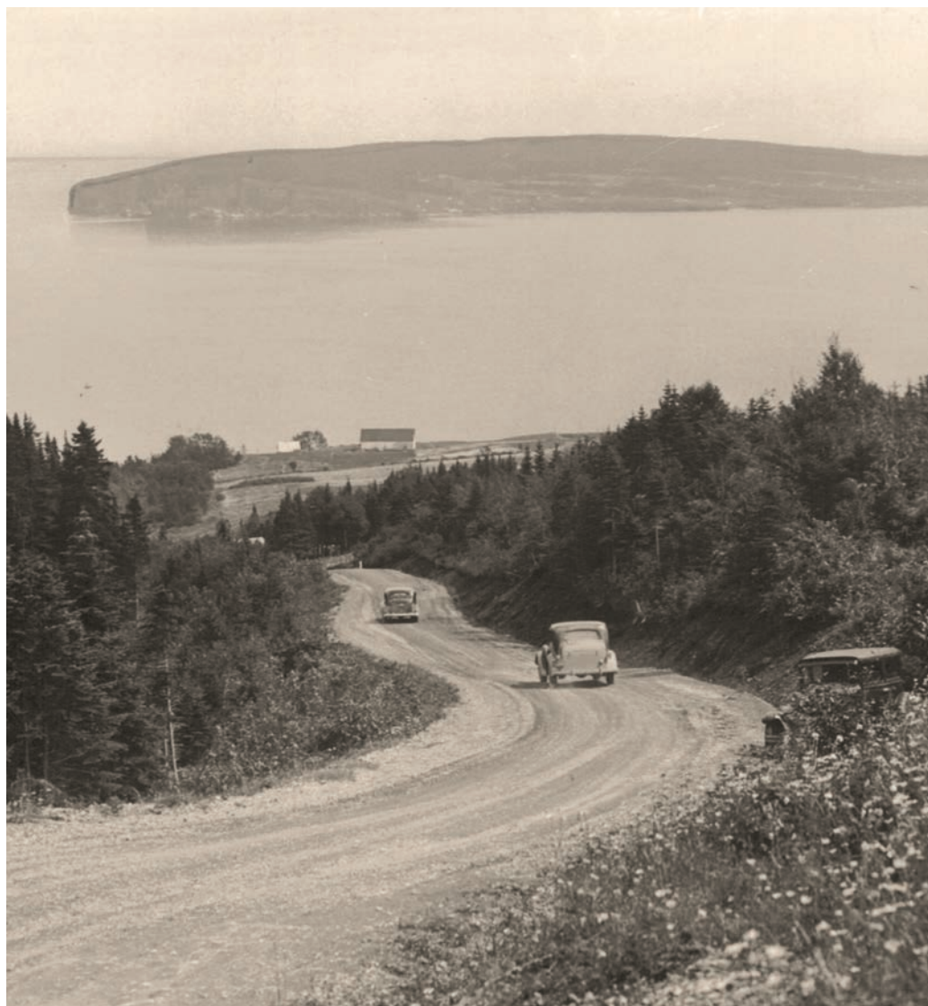
Le Tour de la Gaspésie : toute une aventure en 1930. « The Big Hill at Percé. »

Les membres de l'aristocratie britannique et de la haute bourgeoisie canadienne et américaine sont attirés par les nombreuses et poissonneuses rivières à saumon, par la chasse et par la qualité des bains de mer. À l'époque, on surnomme la Gaspésie The Sportsmen paradise , le paradis du sportif. Ils y séjournent dans des camps de pêche luxueux et dans de somptueuses villas d'été qui voient le jour, à partir de 1850. On en retrouve à Carleton, à New