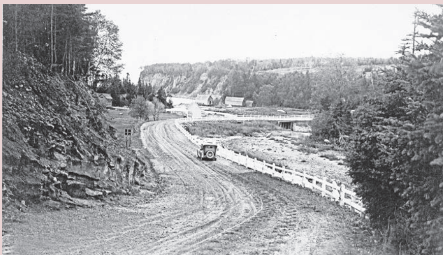
L'automobile représente une nouvelle recrue sur la route de terre de l'Anse-à-Brillant en 1930. Seulement un an après la finition de la ceinture routière quelque 2 015 Gaspésiens possèdent déjà leur automobile. Ces véhicules motorisés sont l'apanage de quelques notables.

Sur la nouvelle route 6 du très accidenté littoral nord, comme ici à l'entrée du village de Rivière-à-Claude, la prudence est de mise pour les automobilistes. Dans son guide touristique de 1930, le ministère de la Voirie ne ménage pas d'en avertir des dangers : « [...] la prudence la plus élémentaire commande donc de donner un avertisseur nécessaire avant de contourner les nombreuses courbes de la route. [...] Longtemps après qu'il a escaladé cette longue rampe, le touriste se souvient des précipices et des ravins, des gorges et des abîmes qui s'ouvrent à des profondeurs illimitées, et un soupir de soulagement soulève sa poitrine lorsqu'il se trouve sur la rampe qui le conduira de nouveau à un niveau moins levé, et plus près du sein de la terre 2 . » Afin de ne pas trop effrayer les touristes, l'édition du guide de 1933 atténue quelque peu sa prose descriptive des dangers !