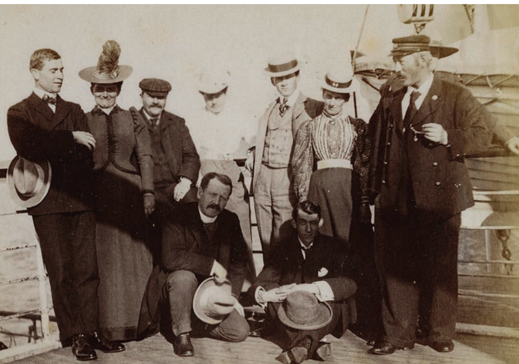
Touristes britanniques en route vers la Gaspésie à bord du S.S. Parisian , vers 1890.

Photo : Musée de la Gaspésie, collection Richard Gauthier, P162/5/80/24