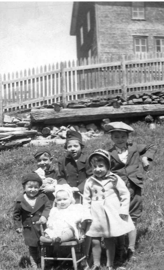
Des cousines et cousins derrière l'école du village, 1941.

Cette journée-là donc, j'ai fait une étourderie. Un de mes oncles dirigeait les activités et il ordonna que l'on descende tous de la charrette pour se rendre ailleurs dans le champ. Moi, j'y suis restée en me cachant dans le foin. Mon oncle, croyant tout le monde à terre, a lancé sa fourche sur le voyage de foin et celle-ci s'est empalée dans l'arrière de ma jambe près du talon. Bien sûr, cela a créé une certaine commotion, mais il n'était quand même pas question d'arrêter le travail pour une petite étourdie désobéissante! La fourche a été retirée de mon talon et on m'a expédiée à la maison avec la recommandation de désinfecter la plaie et de bander mon pied. C'est tout. Encore aujourd'hui, je porte les deux cicatrices que cette aventure a laissées de chaque côté de ma jambe droite.