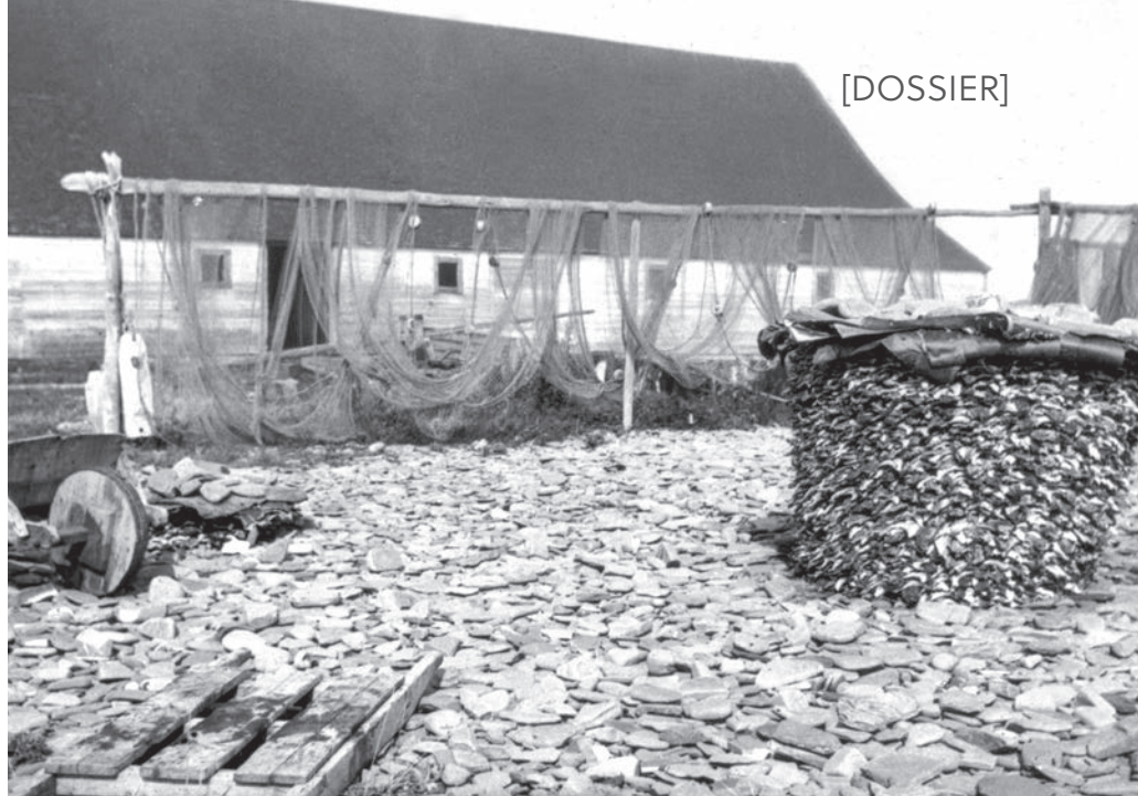
Des morues séchées sur la grave, vers 1900.

La salaison et le séchage font partie des méthodes de conservation de l'époque et les grèves de galets sont priorisées aux dépens des grèves de sable. Longuement polis par l'usage du temps, ces galets ramassés sur les grèves et dans l'estuaire des rivières gaspésiennes captent la chaleur du soleil et deviennent des outils de travail recherchés. Dès l'arrivée, l'équipage prépare la grève, arrachant les herbes et les algues et lavant les galets sur lesquels séchera le poisson. Une fois les morues bien salées,