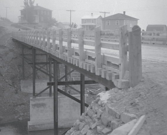
Nouveau pont à la suite de l'écroulement du pont couvert, 1953.