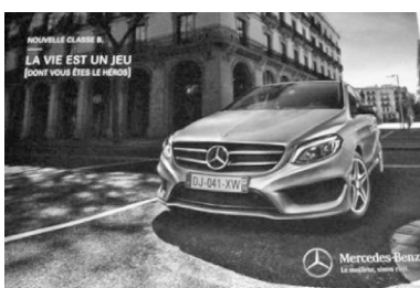
Campagne Mercedes (Classe B) 2017 Il est temps de grandir