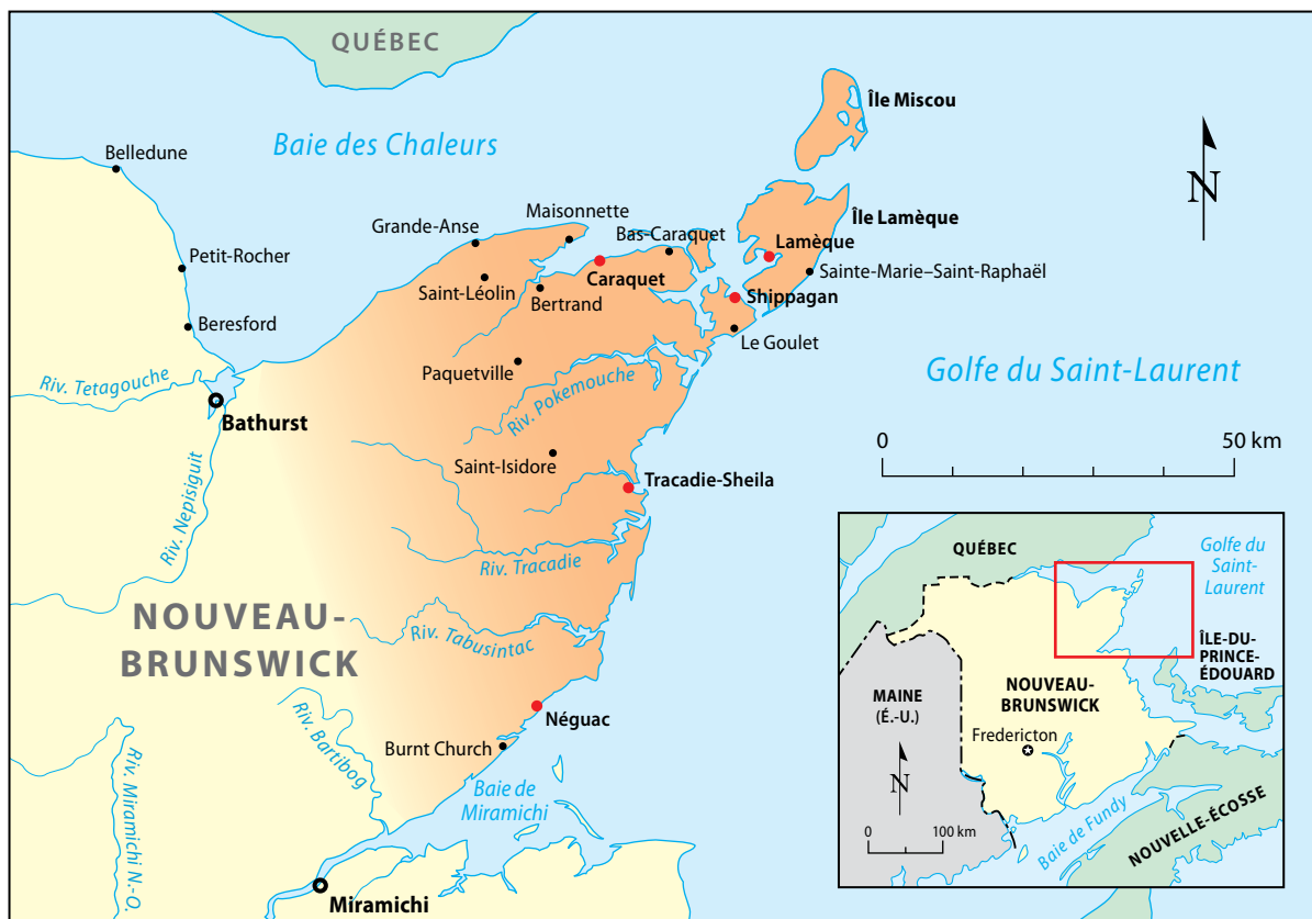
Carte 1 Territoire de la Péninsule acadienne