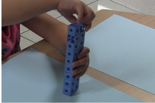
FIGURE 5. Image extraite de la vidéo de Claudine pour la tâche non contextualisée.

Cette stratégie « mesure » peut être associée à un raisonnement sur les relations et donc à une pensée algébrique, car l'enfant compare les mesures de deux tours sans nécessairement connaître le nombre de cubes de chaque tour. Elle pourrait ainsi se généraliser à un certain nombre de cubes, bien que celle-ci soit limitée par la manipulation spatiale de ces objets. Cette généralisation est aussi limitée par le type d'objets choisis. En effet, nous pouvons comparer le nombre de cubes de chaque côté en les mesurant parce que les cubes étaient emboîtables, mais la procédure ne peut être généralisée dans tous les cas (p. ex. deux ensembles de cubes et de cartes) afin de conceptualiser les propriétés algébriques. Comme le signale Mix (1999), le succès des élèves dans une situation dépend du matériel concret utilisé. En ce sens, le contexte des situations proposées et du matériel utilisé sont des éléments importants pour évaluer la pensée algébrique chez les enfants d'âge préscolaire, mais aussi pour construire des activités d'enseignement qui développent le sens de la notion d'équivalence (Taylor-Cox, 2003) et de la pensée algébrique.