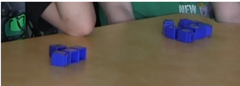
FIGURE 1. Cubes donnés à chaque élève pour représenter les œufs au chocolat dans la tâche contextualisée

Pendant la collecte de données, la chercheure a lu une partie de l'histoire aux enfants en grand groupe. Ensuite, en dyade les élèves ont choisi chacun un personnage. Puis, la chercheure a distribué 8 cubes et 4 cubes pour symboliser les œufs de chocolat trouvés par les personnages (Figure 1). Enfin, la chercheure a demandé : « Que devez-vous faire pour respecter la règle d'or? »