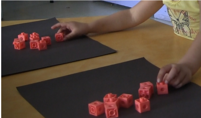
FIGURE 7. Image extraite de la vidéo de Francine pour la tâche non contextualisée.

À ce moment, la chercheuse lui a demandé si elle était certaine que c'est encore « égal ». L'enfant a répondu « oui ». La chercheuse lui a demandé comment elle sait, puis l'enfant a répondu : « À cause que j'ai un à chacun, à eux autres ». Puis elle a compté 9 cubes de chaque côté (comptage).