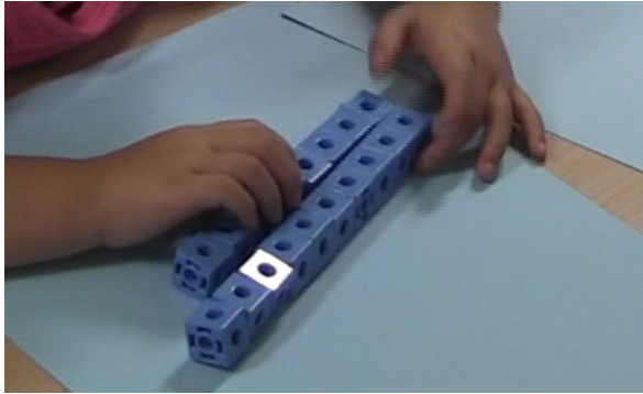
FIGURE 4. Image extraite de la vidéo de Claudine pour la tâche non contextualisée.

La stratégie mesure. Pour la tâche non contextualisée, trois élèves parmi 36 ont mis en place la stratégie que nous avons dénommée « mesure ». Par exemple, après avoir emboîté linéairement les cubes de chaque collection et les avoir mis côte à côte pour comparer leurs longueurs (Figure 4), Claudine a répondu à la première question en disant : « c'est pas pareil, celle-là est plus longue ».