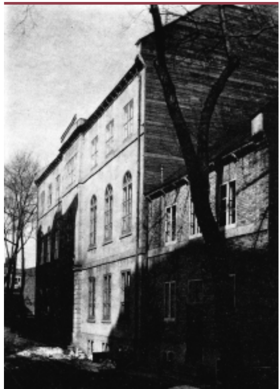
Figure 3. Ancien pavillon de médecine.