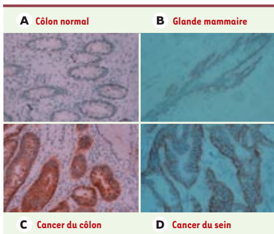
Figure 2. Expression tissulaire des isoformes de CD44 contenant l'exon v6. A. Côlon sain. B. Glande mammaire. C. Polypes adénomateux du côlon. D. Tissu mammaire cancéreux. Le marquage a été réalisé avec un anticorps spécifique de CD44, v6, et avec de l'hématoxyline. On notera que, dans le tissu mammaire normal, seules les cellules myoépithéliales sont positives alors que, dans le tissu cancéreux correspondant, les cellules épithéliales sous-jacentes sont aussi marquées.