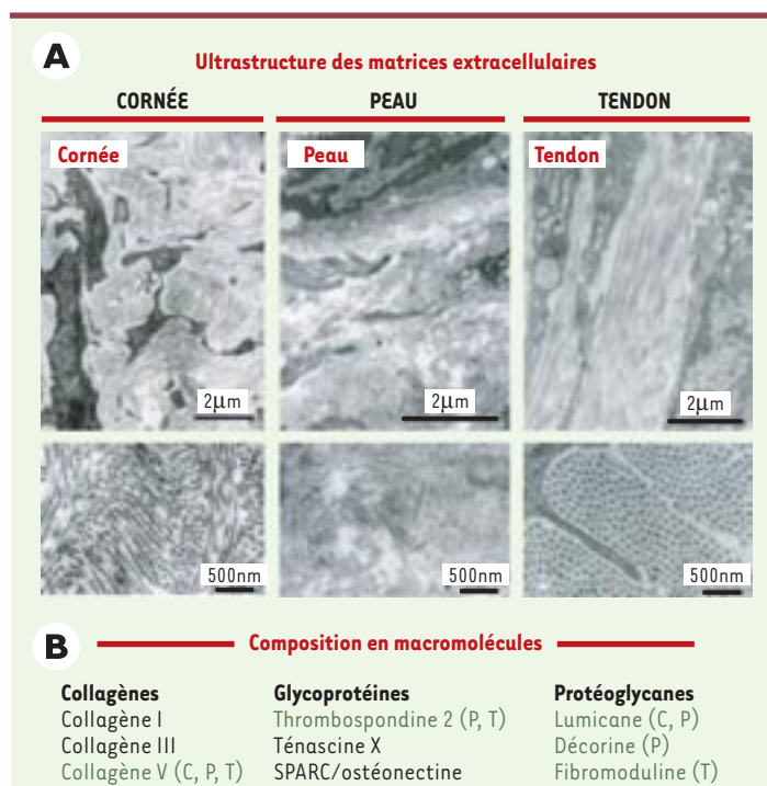
Figure 1. Ultrastructure des matrices extracellulaires et composition en macromolécules. A. Organisation du réseau collagénique adaptée à la fonction des tissus: la cornée, où les fibres s'agencent en un contre-plaqué extrêmement régulier dont dépend la transparence de ce tissu; la peau, où les fibres de collagènes, de section hétérogène, ne présentent aucune direction privilégiée et sont garantes de la cohésion de ce tissu particulièrement élastique et déformable; le tendon, où les faisceaux de fibres, parallèles les uns aux autres, forment de solides câbles capables de résister aux forces de tensions considérables que subit ce tissu. B. Composants matriciels présents dans quelques-uns des tissus cibles de l'EDS de type classique: la cornée (C), la peau (P) et le tendon (T). En vert, molécules dont l'absence totale ou une mutation provoquée affectent en priorité l'un des tissus présentés (d'après les connaissances actuelles [3,26-30,33]).

tion de collagènes de type différents, qui peuvent être synthétisés dans une même cellule et qui s'assemblent à l'extérieur de la cellule pour former des fibres mixtes, dites alors hétérotypiques (Figure 2). De telles fibres, composées de collagènes I, III et V sont présentes dans les tissus atteints des sujets porteurs d'EDS (peau, tendon et os) alors que les assemblages II et XI sont presque exclusivement restreints aux tissus cartilagineux. La quantité relative de chacun de ces composants au sein d'une même fibre a une incidence directe sur son diamètre, qui, en retour, semble déterminer certaines propriétés tissulaires. Par exemple, un tissu comme l'os, où la solidité est requise, présente de larges fibres hétérotypiques I/V (100-150 nm de diamètre moyen) pour lesquelles la quantité de collagène V est largement minoritaire (moins de 1 % par rapport au collagène I). La cornée contient des fibres comportant les mêmes types de collagène, mais où