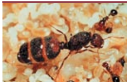
Figure 3. La reine de la fourmi de feu. Chez Solenopsis invicta , c'est la reine qui détermine la valeur du sex-ratio en pondant un nombre plus ou moins grand d'œufs haploïdes (mâles).

L'exemple de Dinoponera quadriceps est démonstratif de ces luttes intestines. La reproduction est réglée par l'existence d'une hiérarchie de dominance, la gamergate occu-