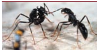
Figure 5. Conflits entre la gamergate et une ouvrière subordonnée chez Dinoponera quadriceps . Chez ces fourmis sans reine, toutes les ouvrières possèdent une spermathèque et peuvent

The haplodiploid sex-determining system of Hymenoptera, whereby males usually develop from unfertilised eggs and females from fertilised eggs, results in relatedness coefficients that are not uniform among colony members. These asymmetries in relatedness are directly affected by the genetic architecture of the colony, which in turn depends on various factors such as queen number or queen mating frequency. Relatedness asymmetries induce different fitness returns per unit investment and, as a result, conflicts over brood composition may arise among colony members. Conflicts between the queen(s) and the workers over sex ratio represent one of the most frequent conflicts in eusocial Hymenoptera. Arrhenotoky allows queens great flexibility to control the sex of their progeny, by fertilizing or not the eggs; however because workers take care of the brood, they may influence the sex ratio by preferentially rearing one sex. Another salient conflict concerns the females over reproduction. In species where workers can mate and reproduce, physical aggressions or chemical communication may lead to dominance hierarchies for access to reproduction. ♦