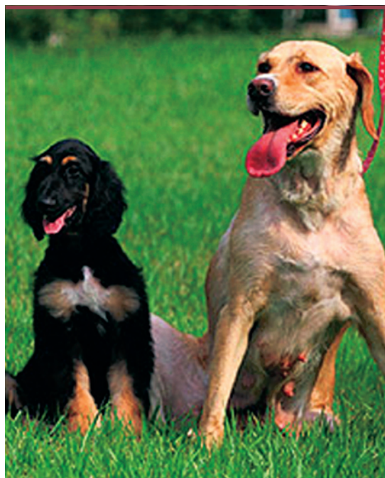
Figure 2. Snuppy et sa mère porteuse, une femelle labrador.