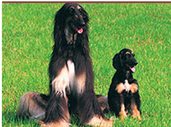
Figure 1. Snuppy (à droite) à côté du lévrier adulte à partir duquel il a été cloné.