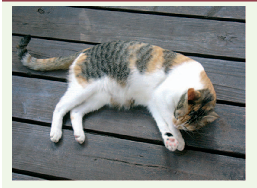
Figure 3. Lola, une chatte à robe calico. L'aspect tigré de type «écaille de tortue» est dû à l'allèle sauvage A. Il est modifié par un gène épistasique (avec les allèles O et o) qui est porté par le chromosome X. Du fait de l'inactivation au hasard des X, la fourrure qui en résulte est unique.