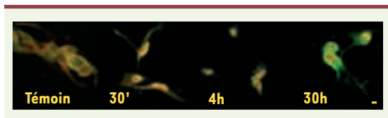
Figure 1. Trafic nucléocytoplasmique du GR et de SRC-1 dans les cellules de Schwann. Le GR (fluorochrome rouge) et SRC-1 (fluorochrome vert) réalisent un trafic nucléocytoplasmique et sont localisés dans le cytoplasme des cellules « témoins ». Au bout de 30 minutes d'induction par les glucocorticoïdes, GR et SRC-1 entrent dans le noyau. Une fraction de SRC-1 ressort du noyau au bout de 30 heures de traitement des cellules par les glucocorticoïdes, probablement pour être dégradée par le protéasome.

que CBP et p300, ce qui pose un problème de sélectivité hormonale. Plusieurs questions ont été posées : le GR recrute-t-il au hasard les p160 ou bien des paramètres externes comme la nature du ligand, le contexte cellulaire ou le promoteur cible peuvent-ils guider ce recrutement ?