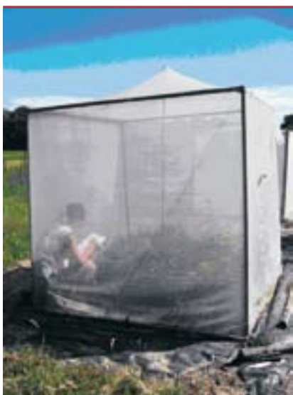
Figure 2. Séance d'observation du comportement de butinage.

Nous avons constaté que l'impact des traitements de pollinisation sur le succès reproducteur des plantes n'est pas le même dans les trois communautés végétales expérimentales. Dans les communautés composées uniquement du groupe fonctionnel « fleurs en assiette », le succès reproducteur est identique, quelle que soit la diversité des pollinisateurs. En revanche, dans les