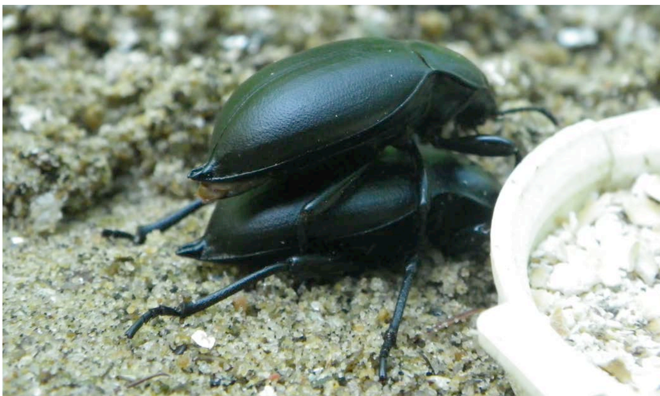
Figure 5. Les 2 mâles du ténébrion des écuries âgés de 7 ans, dans leur cage d'élevage faite d'une boîte de muffins.