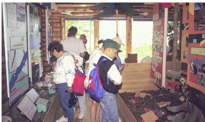
Le centre d'interprétation Philéas-J.-Fillion à l'île aux Basques.