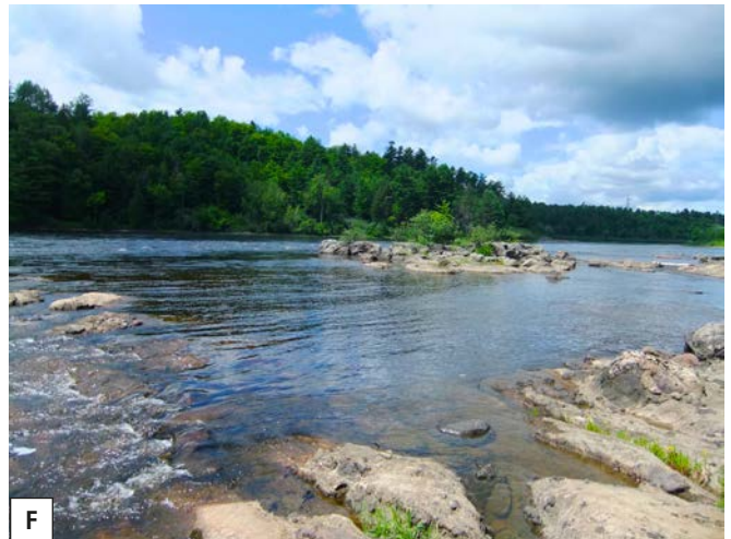
Figure 2. Aperçu des sites d'inventaire : a) site 2 (rivière des Outaouais en amont des rapides Deschênes, le 10 juillet 2013); b) site 3 (rivière des Outaouais en aval des rapides Deschênes, le 19 août 2013); c) site 21 (étang, lieu-dit marais Lamoureux, le 21 mai 2014); d) site 25 (étang littoral le 3 juillet 2014, avec les rapides Deschênes de la rivière des Outaouais visibles en arrière-plan); e) site 29 (milieu humide temporaire en voie de s'assécher, le 27 juillet 2014); f) site 11 (rivière Gatineau en amont des rapides Farmer, le 17 juillet 2014).