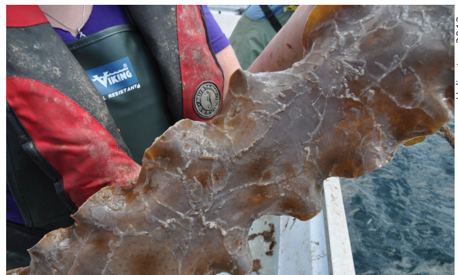
Figure 7. Infestation d'une fronde de laminaire sucrée ( Saccharina latissima ) par les colonies du bryzoaire envahissant Membranipora membranacea sur une ferme d'algoculture, en juillet 2012.

Le pourtour du golfe du Saint-Laurent, avec ses côtes rocheuses, abrite de nombreux champs d'algues qui jouent un rôle essentiel dans le fonctionnement de l'écosystème. La partie québécoise du golfe est considérée comme un environnement de transition boréal-subarctique et, à ce titre, elle possède des particularités qui la différencient des autres régions côtières de l'Atlantique Nord. En effet, dans l'ÉMSL l'action récurrente des glaces d'hiver et l'abondance des oursins sont 2 facteurs majeurs qui contrôlent la répartition et l'abondance des algues dans l'étage intertidal et infralittoral. Les champs d'algues de l'ÉMSL contiennent aussi en abondance plusieurs