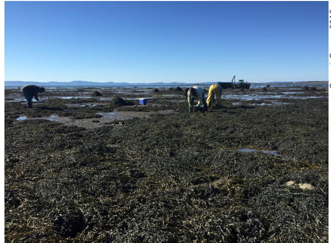
Figure 5. Récolte d'algues brunes dans le Bas-Saint-Laurent.

Même si quelques promoteurs privés ont réalisé leurs propres inventaires et ont montré qu'à plusieurs endroits les densités et les superficies des champs d'algues étaient suffisantes pour justifier une exploitation commerciale (Béland, 2012),