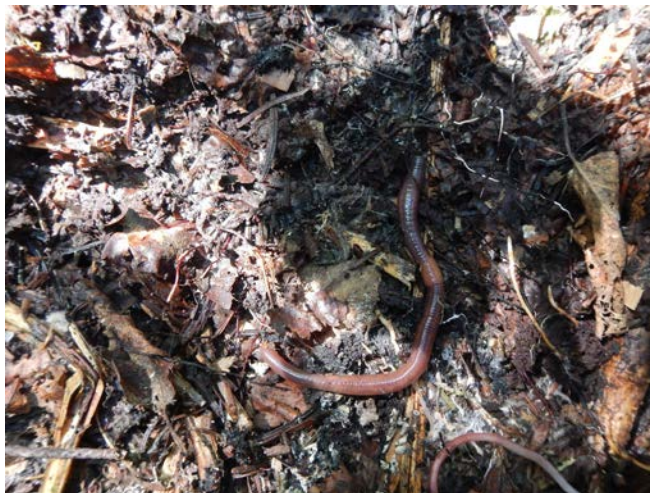
Figure 2. Exemple de débris ligneux sous lesquels les vers de terre ont été observés le long de sentiers pédestres de l'île aux Basques.