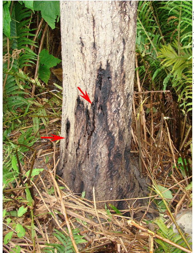
Figure 2. Ces chancres ont fusionné à la base de ce noyer cendré, ce qui finit par tuer l'arbre. L'écoulement d'un liquide noirâtre est visible chez certains chancres (flèches).

Outre les pluies, accompagnées de vents ou non, nécessaires à la dissémination des conidies d' Oc-j , on connaît peu de choses sur les facteurs favorisant le développement du CNC. Il semblerait que de petites populations de noyer cendré pourraient s'être développées de façon cryptique, c'est-à-dire dans des refuges à l'abri de toute contamination, particulièrement dans le nord-est de l'aire de répartition de l'espèce après la dernière glaciation (Laricchia et collab., 2015). Une étude récente (Sambaraju et collab., 2018) a rapporté que les noyers cendrés poussant au sud et à l'ouest du Québec avaient plus de chances de développer des chancres que ceux situés au nord-est de l'aire de répartition de l'espèce. D'après les analyses des autres données obtenues, il semble que la