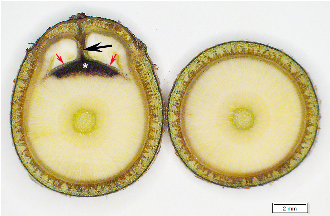
Figure 3. Chez un témoin inoculé avec une pastille d'agar non colonisée par Ophiognomonium clavignenti-juglandacearum ( Oc-j ), coupes transversales d'une tige d'un plant montrant la zone affectée (astérisque) par la blessure (à gauche). Cette zone est recouverte entre autres par des tissus subérisés (flèches rouges) laissés par l'écorce externe des deux parties du bourrelet cicatriciel qui sont sur le point de fusionner (flèche noire). À 1,5 cm au-dessus de la blessure, il n'y a aucune trace de nécrose (à droite). Un seul individu inoculé avec Oc-j présentait exactement ce genre de mécanismes de défense.

pas de symptômes après la dormance, et de les disséquer pour examiner si le compartimentage était efficace pour confiner les tissus envahis. Seuls les individus réussissant à compartimenter efficacement les zones affectées devraient être retenus dans des programmes de conservation et de rétablissement de l'espèce.