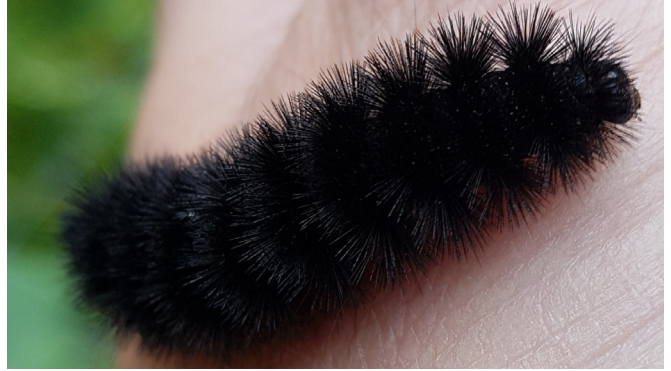
Figure 3. Chenille de Hypercompe scribonia , 2 août 2019, à Montréal, Québec, Canada.