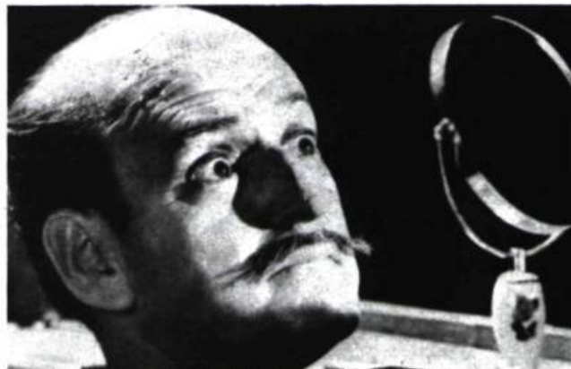
Tony Randall, un des premiers Hercule Poirot du cinéma, dans une curieuse scène du film de Frank Tashlin Hercule Poirot contre ABC (1964)

Hercule Poirot. — Voilà, c'est avec des titres de ce tonneau que vous avez abusé de la bienveillante patience des lecteurs!