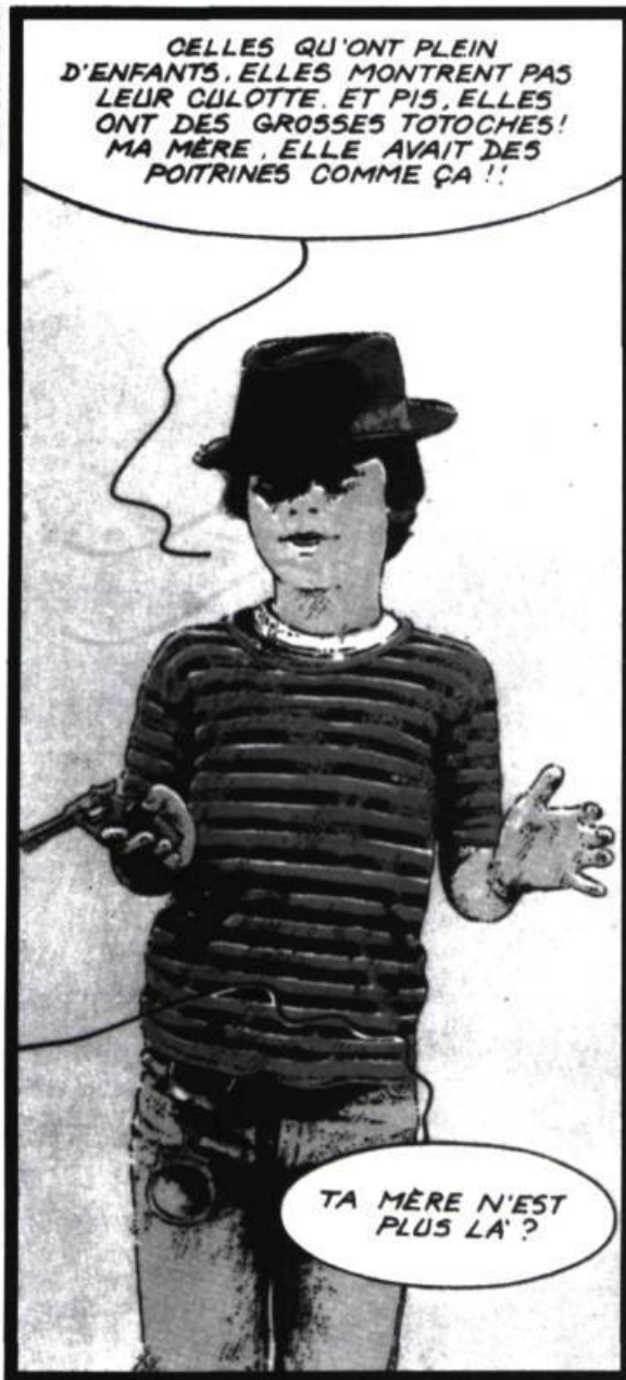
Bloody Mary, textes Jean Vautrin, images Jean Teulé

être vrai, ce que je raconte. C'est le monde à l'envers. Ça trahit comment les gens reçoivent l'information. Il faut que ce soit un spectacle. À partir du moment où tu leur parles de leur vie à eux, ils se demandent: «Moi, je suis de l'information?» — «Tu penses que j'ai quelque chose à dire?» Ils sont tellement exclus de ce discours, de cette écriture journalistique. Quand ils se voient dedans... ils n'y croient pas.