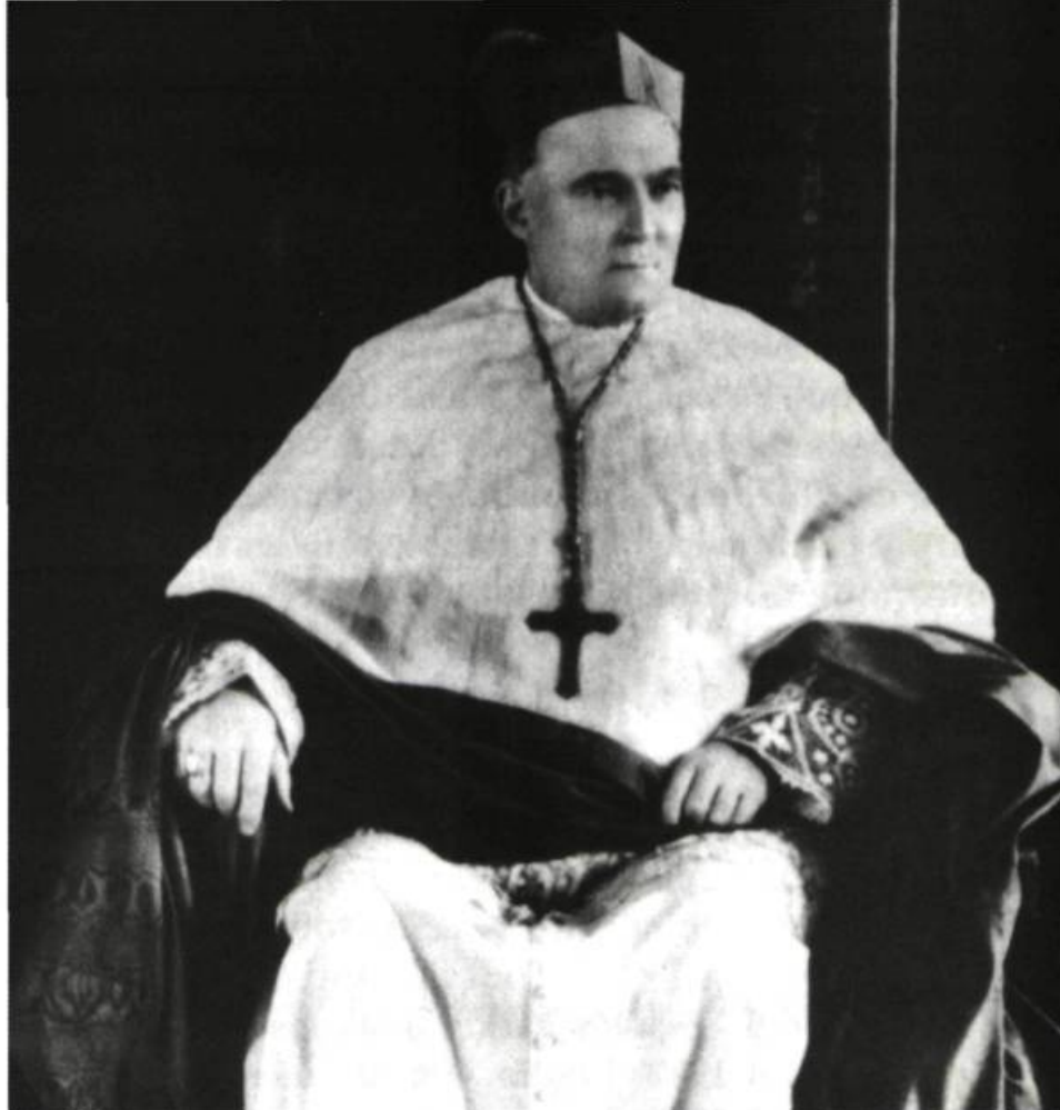
Son Éminence le Cardinal Raymond-Marie Rouleau

Vatican I insistait sur l'institution. L'Église se comprend à partir