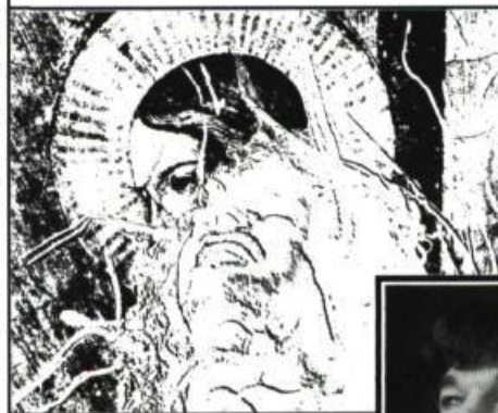
Photocollage: AREL JONES

Un soir, Bob fait la connaissance d'un groupe d'amies au Lux , ce restaurant à la mode de Montréal. En congé de maladie à cause d'un problème de surdité, il aura l'occasion de les revoir à plusieurs reprises. Mais pourra-t-il passer à travers l'épreuve des discours que ces filles pratiquent? Elles ont tout lu, tout vu, ont réponse à tout et cherchent à l'initier à leur science infuse, pour lui confuse... Au bout du compte, réussira-t-il à sauver sa peau de chagrin?