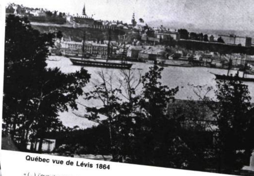
Québec vue de Lévis 1864

« (...) j'eus du plaisir à songer que la ville avait un cœur féminin comme le mien, que personne d'autre ne le savait et qu'en quelque sorte mon cœur était à l'abri derrière les murs du Vieux-Québec. »