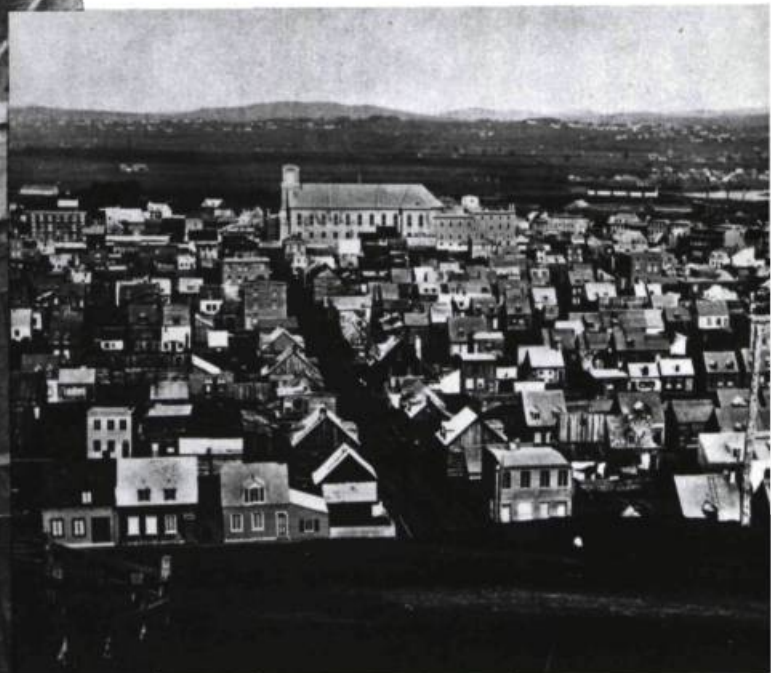
Le quartier Saint-Sauveur