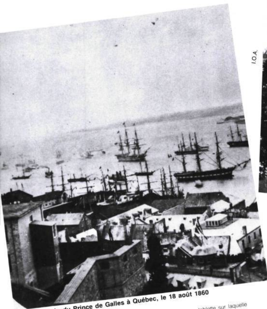
L'arrivée du Prince de Galles à Québec, le 18 août 1860

« (...) mais la fenêtre du salon, percée en ogive et munie d'une tablette sur laquelle deux personnes pouvaient s'asseoir à l'aise, donnait une très large vue sur le fleuve, la rive sud et même le pont de l'île d'Orléans. »