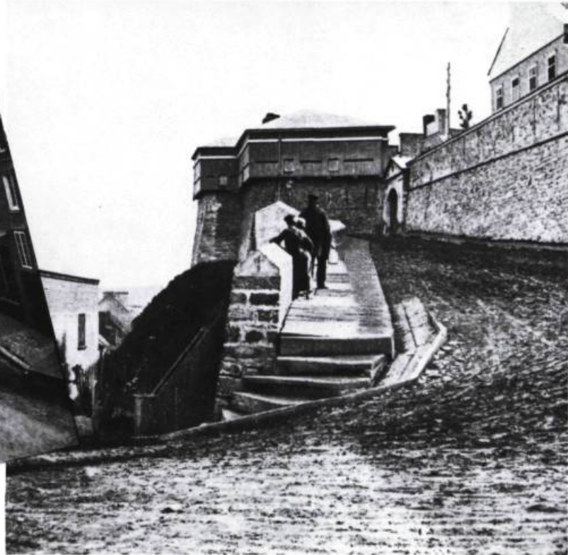
La porte Hope vue de (l'extérieur)

« Le matin, Québec est tellement agréable ; les gens prennent l'autobus, vont travailler, les moineaux mangent le crottin. Tout est discipliné. On sent la vie. » Mon cheval pour un royaume, p. 15.