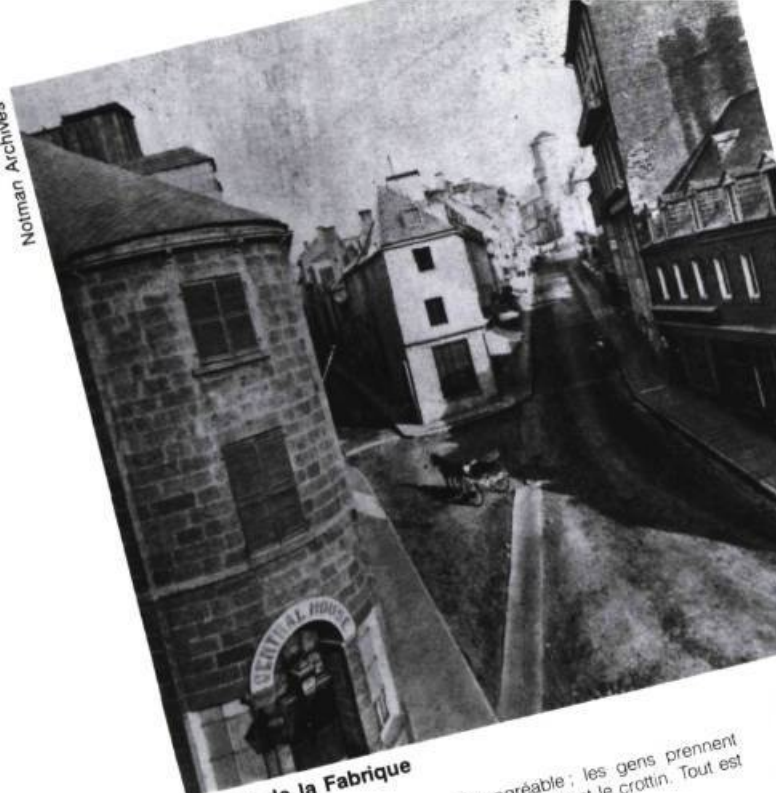
La rue de la Fabrique

« Le matin, Québec est tellement agréable ; les gens prennent l'autobus, vont travailler, les moineaux mangent le crottin. Tout est discipliné. On sent la vie. » Mon cheval pour un royaume, p. 15.