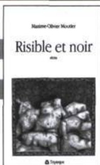
Maxime-Olivier Moutier Risible et noir récits 137 p., 17 $

« C'est le noir. Le noir presque bleu. Bleu comme les chats. Le noir nu. Le soir d'avant le début de l'univers. Avant le commencement. Avant le premier meurtre. C'est la nuit comme lorsqu'on cherche à expliquer un film d'horreur. La nuit comme quand on trouve une arme dans le tiroir de chevet de son papa. Toute prête. Toute bien chargée. Une balle pour chaque membre de la famille. La famille de ce siècle. »