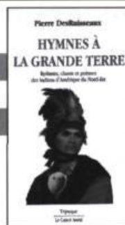
Pierre DesRuisseaux Hymnes à la Grande Terre Rythmes, chants et poèmes des Indiens d'Amérique (Nord-Est) 265 p., 15 $

« C'est le noir. Le noir presque bleu. Bleu comme les chats. Le noir nu. Le soir d'avant le début de l'univers. Avant le commencement. Avant le premier meurtre. C'est la nuit comme lorsqu'on cherche à expliquer un film d'horreur. La nuit comme quand on trouve une arme dans le tiroir de chevet de son papa. Toute prête. Toute bien chargée. Une balle pour chaque membre de la famille. La famille de ce siècle. »