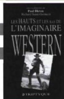
Paul Bleton et Richard Saint-Germain (sous la dir. de) Les hauts et les bas de l'imaginaire western 240 p., 25 $

Première anthologie de poèmes traditionnels amérindiens publiée au Québec, ce livre vise avant tout à susciter la curiosité et l'intérêt pour un imaginaire d'une immense richesse et d'une profondeur mythique incontestable. Proposant plus de 120 textes paraissant souvent pour la première fois en français, cette anthologie présente un éventail étendu de la culture orale amérindienne du Nord-Est.