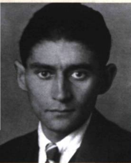
Franz Kafka à quarante ans, 1924

Tout ça, c'est la langue, c'est donné par la langue. Dans son cas, il savait, il sentait et l'entourage hostile dans lequel il vivait le lui faisait sentir naturellement, il savait qu'il n'avait pas reçu cela en partage. Il n'avait pas, si vous voulez, la langue allemande de naissance, il l'avait encore un peu par hasard, et encore une fois bien qu'il n'en eût pas d'autres. Il faut bien se représenter cette façon de vivre intérieurement un phénomène extérieur, dont, encore une fois, il aurait pu s'accommoder.