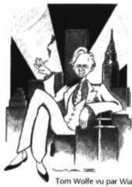
Tom Wolfe vu par Wiaz

De l'écrivain polonais, qui faisait paraître en 1951 Un monde à part (Denoël), récit de son internement au Goulag, voici Les perles de Vermeer, Journal écrit la nuit 1986-1992 et un recueil de nouvelles, Variations sur les ténèbres , tous deux publiés au Seuil dans la traduction de Thérèse Douchy. Du goulag aux temps d'aujourd'hui, il y a toujours matière à s'interroger. Les réflexions de Gustaw Herling peuvent contribuer à rendre les nôtres plus ajustées à des réalités qui nous demeurent trop souvent étrangères.