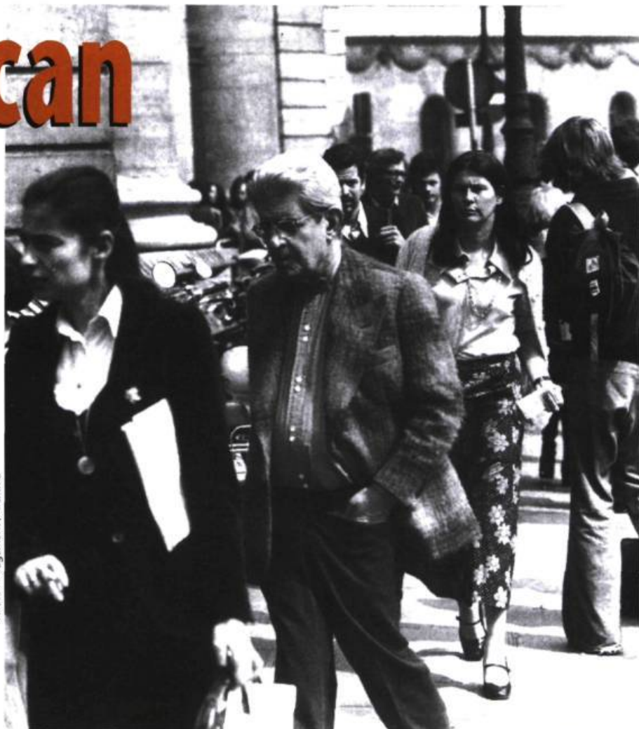
Lacan à Paris dans les années 70.

M ais Freud et Lacan ne sont pas que des psychanalystes, ce sont aussi des littéraires, tant par leur prose que par leur intérêt pour la littérature. Nous savons, depuis les premiers travaux de Freud, combien les grandes références littéraires, de Sophocle à Dostoïevski, ont nourri le savoir analytique. Freud a insisté sur le fait qu'un bon psychanalyste devait être tout autant pétri de culture et de littérature que de connaissances cliniques. Idéalement, « l'enseignement analytique engloberait aussi des spécialités qui sont étrangères au médecin et qu'il ne rencontre pas dans son activité professionnelle : histoire de la civilisation, mythologie, psychologie des religions et littérature. Sans une bonne orientation en ces domaines, l'analyste reste sans comprendre une grande partie du matériel qui s'offre à lui 1 ». Lacan entendra la leçon : « Pour interpréter l'inconscient comme Freud, il faudrait être comme lui une encyclopédie des arts et des muses 2 . » Inversement, dès les premières traductions de Freud en France, les écrivains ont à leur tour puisé dans la psychanalyse, parfois maladroitement, souvent avec bonheur. L'on songera en particulier aux travaux des surréalistes, mais aussi au nouveau roman des années 20, par