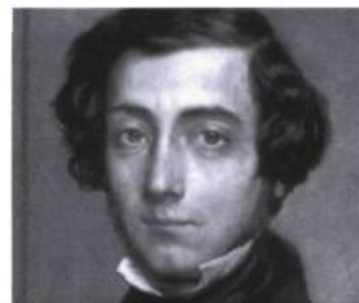
Alexis de Tocqueville