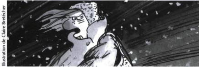
Illustration de Claire Bretécher