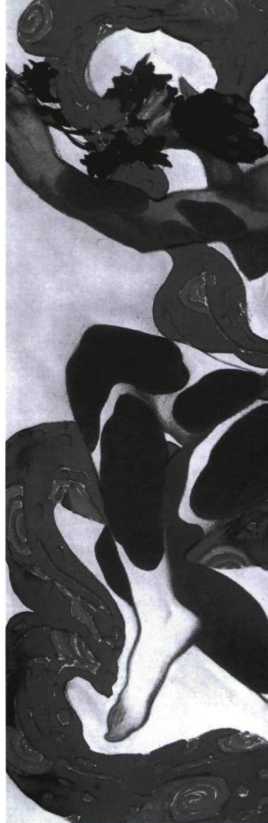
Vaslav Nijinski en faune par Léon Bakst pour le ballet L'après-midi

de police, d'espionnage dont il est ici question, et cela, de façon rigoureuse. La « haute police » n'occupe pas toujours l'avant-scène, mais nul ne règne longtemps sans elle. Elle obéit à certains dompteurs particulièrement inflexibles et élimine sans état d'âme quiconque renonce aux avantages du contrôle. Directement ou par dictateurs interposés, elle est responsable, rappelle