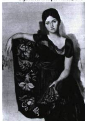
Olga Khokhlova par Picasso, 1917.